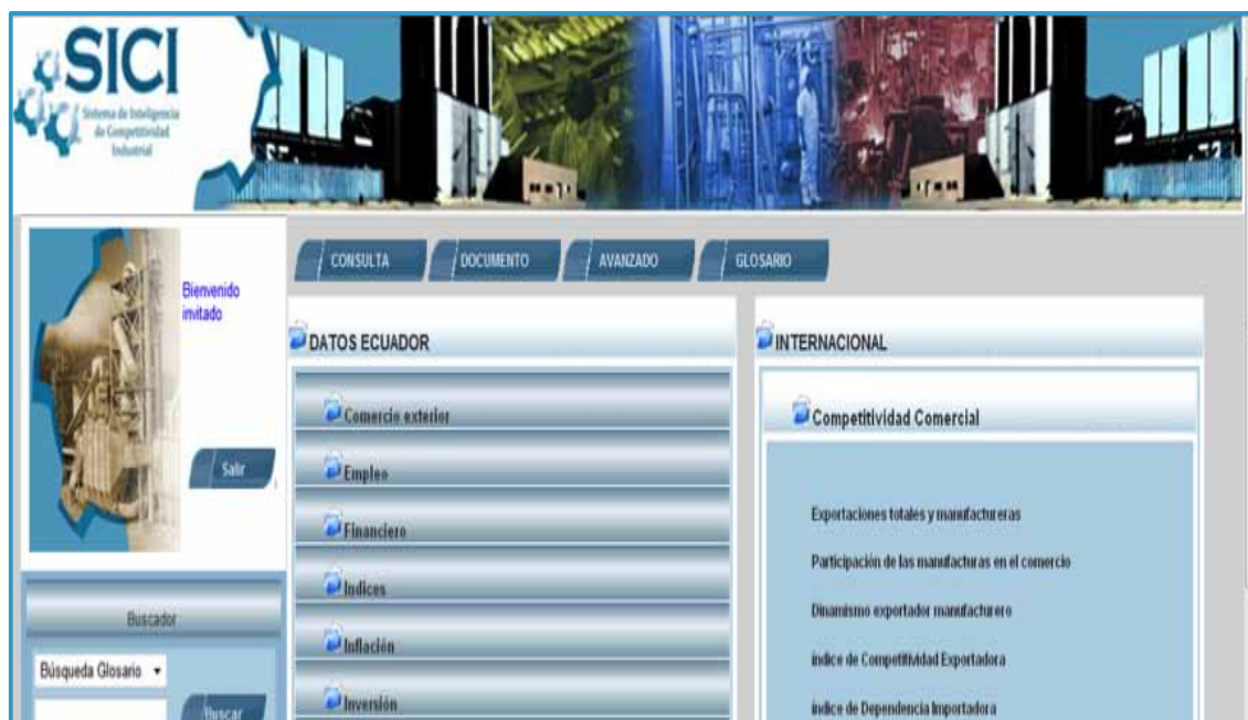
Figure 2. Exemple de l'application logicielle de l'ONUDI, ICIS